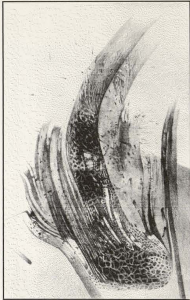
ELŻBIETA HOŃDO – CYKL "TERRA" rysunek